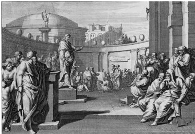
Paulus preekt op de Areopagus (Handelingen 17, vs. 22)